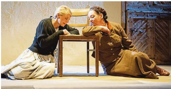
Die Württembergische Landesbühne bringt „Herbstmilch“ auf die Bühne des PUC.